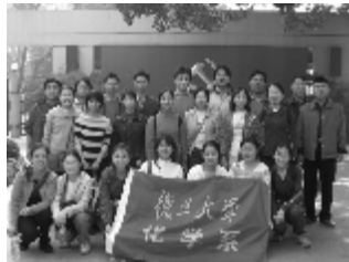
05化学硕：热血豪情前程似锦

的：“在我们脚下是一条无尽的道路，身后是辉煌的过去，眼前是灿烂的前程。热血扬兮豪情壮，文章焕兮前程锦。无论道路平坦与崎岖，我们必将走向理想中那光辉的未来！”