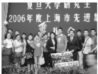
04新闻硕：好学力行“三连冠”

“04新闻实力超群！”答辩会上，新闻学院04级硕士班的口号自信激昂。他们已连续三年拿到市先进集体称号。积极的面貌，奋进的姿态，集体的向心力与凝聚力铸就了他们今日的优秀与荣誉。