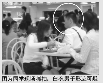
图为同学现场抓拍：白衣男子形迹可疑

上周有热心同学向研报反映，北区食堂中午有小偷出没，有同学财物被盗。据这位同学称，这个两男一女的三人团体通常会乘食堂人最多的时候伺机下手。一般由两个人实施盗窃，另一人负责盯梢，反坐在椅子上。保卫处接到报案后，展开侦查。上周末，小偷落网。