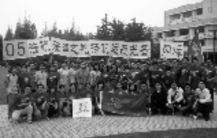
05法硕：扬帆远航光芒闪烁

05级法硕班深入安徽农村，进行主题为“社会主义新农村基层民主建设案例研究”的暑期调研并获佳绩。同学们搜集调研资料，亲身体验基层民主运作，分析推动农村民主建设。调研小组还代表复旦大学法学院与当地签订了《社会实践基地共建协议